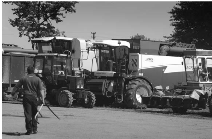
„Elmos“ žemės ūkio bendrovės, priklausančios „Agrokonzernui“, kieme rikiuojasi galinga technika.