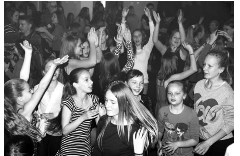
Apdovanojus konkurso nugalėtojus ir virėjas, A. Vienuolio progimnazijos moksleiviai šėlo „Kretingos maisto“ dovanotoje diskotekoje.

zevičiūtė teigė neturinti laiko, tačiau galėtų pagaminti cepelinų, o „Kretingos maisto“ dovanota valgių receptų knyga ji sakė tikrai pasinaudosianti.