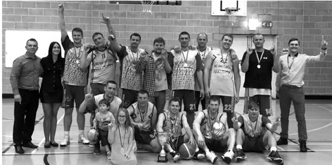
„Anykščiai BC“ pirmą kartą klubo istorijoje iškovojo čempionų titulą...

Antrą sezoną Britanijos lietuvių krepšinio lygoje (BLKL) rungtyniaujanti „Anykščiai BC“ komanda šiemet pasiekė fantastiškų rezultatų. A.Sabonio taurėje iškovota trečioji vieta, o penktadienį iškovotas BLKL čempionų titulas.